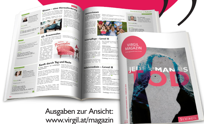
Ausgaben zur Ansicht: www.virgil.at/magazin