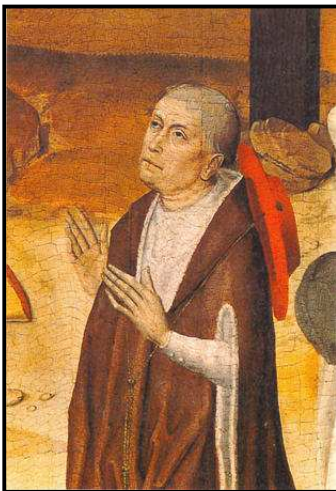
Altartriptychon Nikolaus-Spital, Cues

Im Sommer 1464 wurde Nikolaus im Rahmen des von Pius II. betriebenen Kreuzzugprojekts gegen die Türken beauftragt, sich um eine Schar von 5000 mittellosen und zum Teil erkrankten Kreuzfahrern zu kümmern. Unterwegs zu den Kreuzfahrern im Gebiet um Ancona starb er am 11. August in Todi. Sein Leichnam wurde sogleich nach Rom überführt und in San Pietro in Vincoli beigelegt; sein Herz jedoch wurde auf seinen Wunsch in der Kapelle im St.