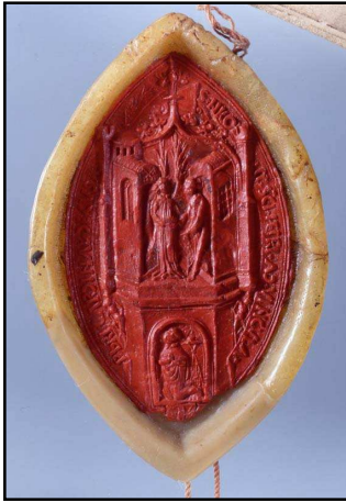
Bischofsiegel, Brixen 1454