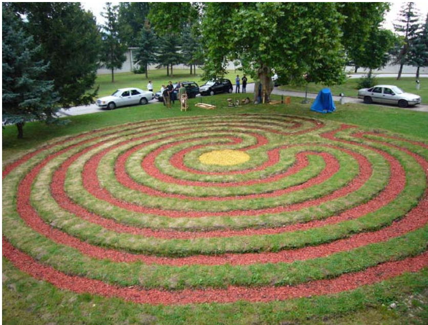
Abb.: Das Labyrinth in Gerasdorf

Vor mir an der Wand hängt ein großes Bild des Labyrinths, das wir im Hof der Anstalt angelegt haben; immer wieder wandert mein Blick dorthin, ruht förmlich darauf. Nicht zufällig, denn durch seine innere Verwandtschaft mit dem Mandala entfaltet das Labyrinth schon beim Betrachten seine sanfte Wirkung.