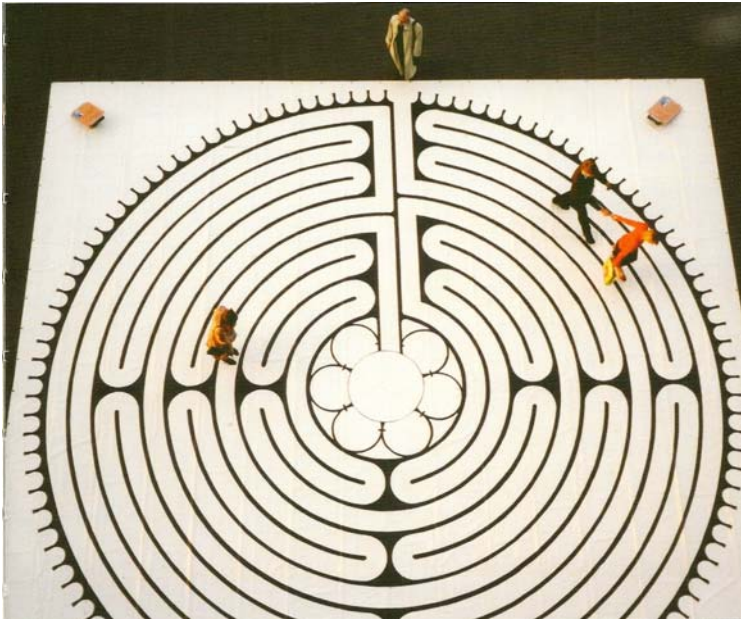
Abb.: Tuch mit dem Labyrinth von Chartres

Am Anfang stand das Tuch, also eine ca. 6x6m große, aus mehreren Leintüchern zusammengenähte Stoffplane, auf die eine Schulklasse ein stark verkleinertes, sonst aber ganz getreues Abbild des berühmten Labyrinths der Kathedrale von Chartres aufgemalt hat: leicht zu transportieren, Staunen erregend beim Ausbreiten und beeindruckend, was die