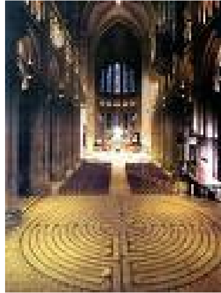
Abb. 2: Kahtedrale von Chartres